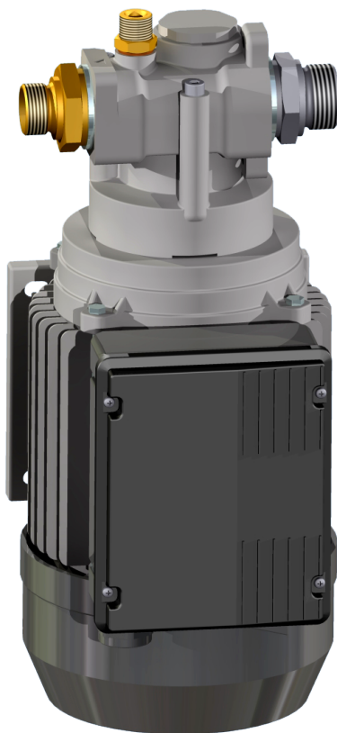
Illustrare OP 145 E